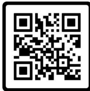
Scan Barcode Lokasi